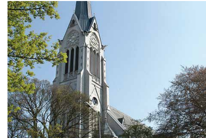
Evangelische Kirche Amriswil Weinfelderstrasse 3