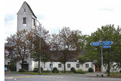
Kirchgemeindehaus Amriswil Romanshornerstrasse 3