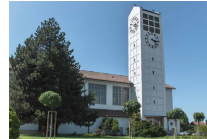
Katholische Kirche Amriswil Alleestrasse 17