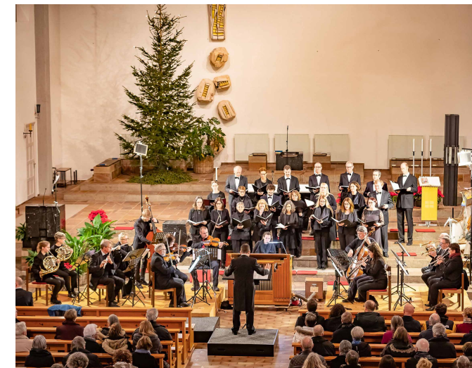
Cappella Vocale Ostschweiz