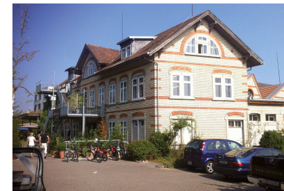
Kulturforum Amriswil Bahnhofstrasse 22