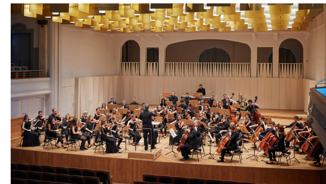
Das Jugendorchester Thurgau bei einem Auftritt in der Tonhalle St. Gallen.